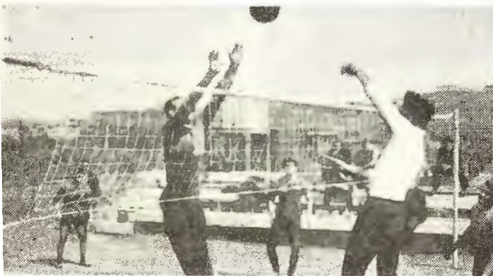
На заводском спортивном комплексе

стерской по ремонту обуви, фотоателье, трикотажным пунктом.