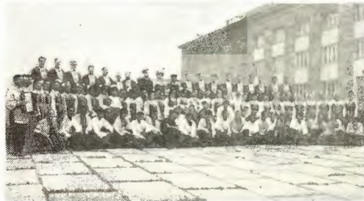
Выступление народного хора тракторного завода