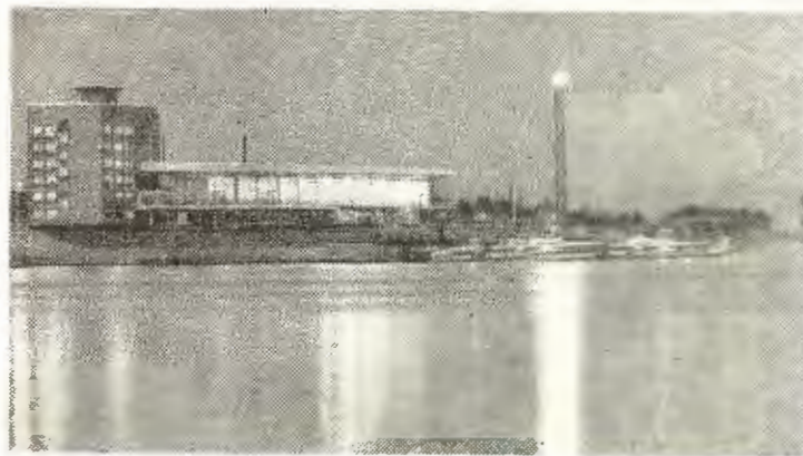
Речной вокзал Павлодара

Постоянная забота о повышении материального благосостояния и культурного уровня трудящихся в нашей стране хорошо видна на примере крупного трудового коллектива, каким является Павлодарский тракторный. За девятую пятилетку было построено 1712 квартир общей площадью 190300 квадратных метров, 8 детских комбинатов на 2240 мест, 10 молодежных общежитий на 3580 мест. Сданы в эксплуатацию заводская поликлиника на 750 посещений в день, центральная фабрика-кухня, стендовый тир, спортивные площадки, прачечный комбинат для стирки спецодежды, комбинат бытового обслуживания с продовольственным магазином и столом заказов, ателье мод, ма-