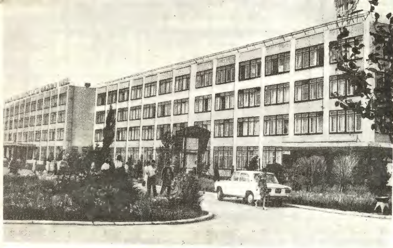
Инженерный корпус завода