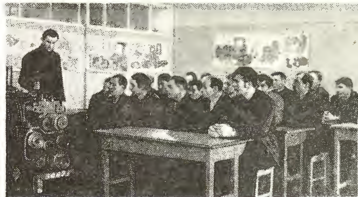
В кабинете технического обучения.

Если вы пришли на завод после окончания школы, техникума или училища, предлагаем вам поступить в Павлодарский индустриальный институт. Два факультета этого института — механико-технологический и машиностроительный готовят специалистов по профилю завода на дневном, вечернем и заочном отделениях. Имеется подготовительный факультет, выпускники которого после успешного окончания зачисляются на первый курс института без вступительных экзаменов.