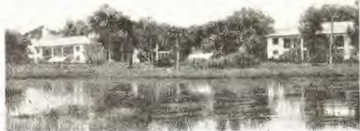
Заводской дом отдыха