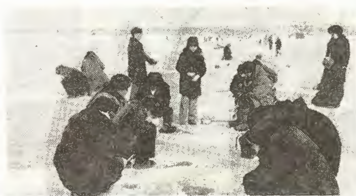
Зимняя рыбалка на Иртыше