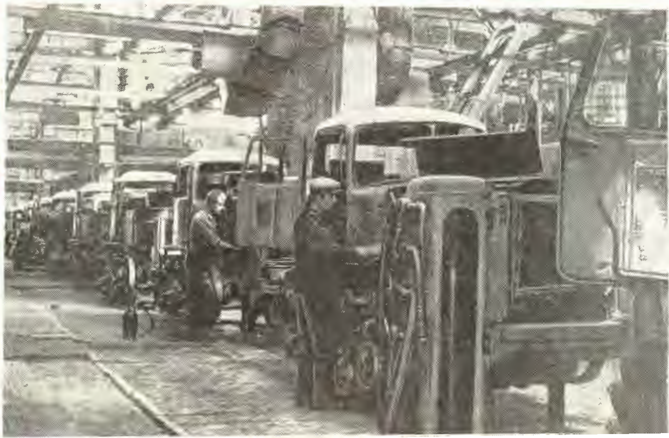
Главный конвейер — сердце завода.